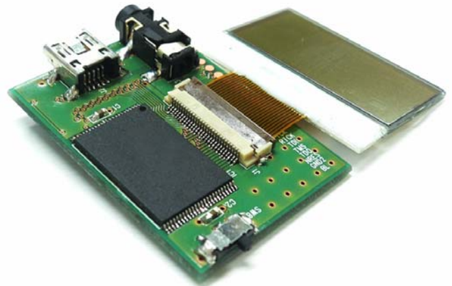
上视图 (TOP VIEW)